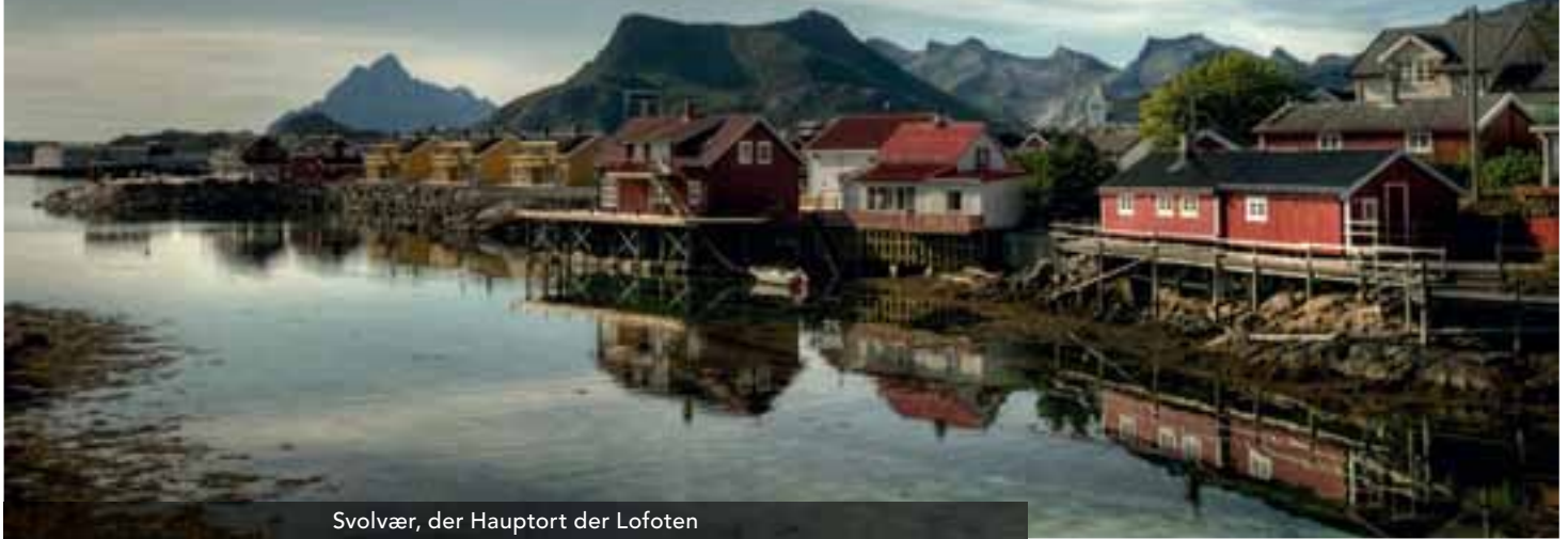
Svolvær, der Hauptort der Lofoten

Die klassische Hurtigruten Rundreise dauert 12 Tage und führt Sie von Bergen bis Kirkenes und zurück. Sie können aber auch kürzere Routen wählen, wie die 11-tägige Reise Bergen – Kirkenes – Trondheim. Wenn Sie weniger Zeit haben, nehmen Sie die 7-tägige nordgehende Route von Bergen nach Kirkenes oder die 6-tägige südgehende Route von Kirkenes nach Bergen. Nutzen Sie die Karte auf der nächsten Seite, um Ihre Reise zu verfolgen. Dort finden Sie auch die Höhepunkte und Preise. Den genauen Reiseverlauf erfahren Sie auf dieser Seite.