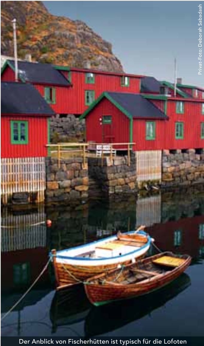
Privat-Foto: Deborah Sabadash